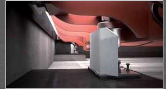
Galvaniseeritud kaitseplaat tagab kaaluanduri täiendava kaitse