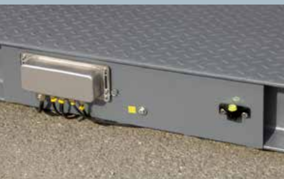
Scatola di giunzione in acciaio Inox Stainless steel junction box